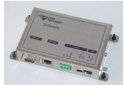
Das Förster-Technik Gateway verbindet Ihre Baby-Mix-Feeder über Ethernet bzw. WLAN mit dem PC.