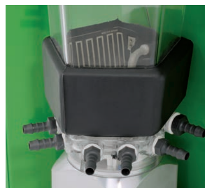
Mixerheizung als Zubehör erhältlich

Der Boiler mit Temperatursensor, elektronischer Heizungsregelung und Mindesttemperaturüberwachung sorgt stets für die richtige Tränketemperatur, die einfach eingestellt und überprüft werden kann.